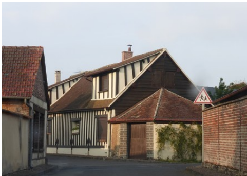
Quelques rues d'Avrilly

Les avis seront cohérents avec ceux émis ces derniers années, à savoir : pas de maisons à volume compliqué (type V, W, Y, ou Z), pentes à 45° pour les volumes principaux, ardoise ou tuile plate de teinte brun vieilli, à 20u/m 2 , avec un débord de toiture de 20cm, enduit de teinte beige clair avec modénatures (au choix : chaînages, encadrement de fenêtres, soubassement, colombage...). *Voir les autres fiches.