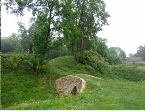
Les anciens fossés de la basse-cour