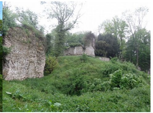
Les fossés entourant la motte