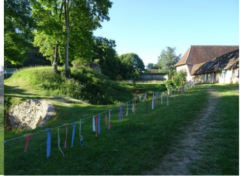
Les fossés et le corps de ferme voisin