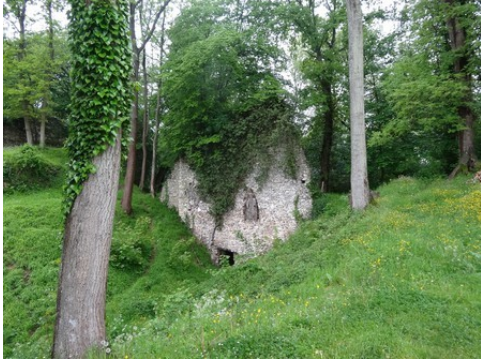
Des vestiges de fortification