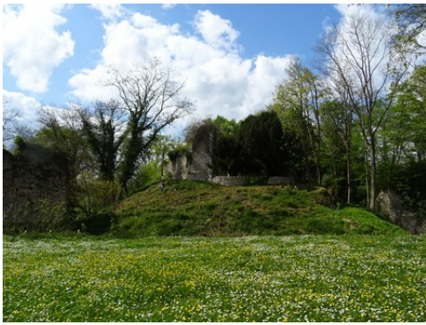
La motte castrale et le donjon