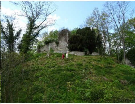
Des vues proches du donjon