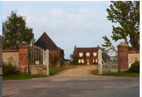
L'entrée d'un corps de ferme